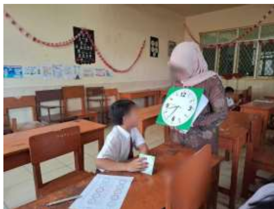
Gambar 3. Pendampingan

Hasil evaluasi menunjukkan bahwa sebagian besar peserta didik telah mampu membaca jam analog dengan lebih baik dan sesuai dengan indikator yang telah ditetapkan. Selain peningkatan kemampuan membaca jam, keaktifan dan partisipasi peserta didik selama proses pembelajaran juga mengalami peningkatan yang cukup signifikan. Luaran dari kegiatan pengabdian ini tidak hanya berupa peningkatan pengetahuan dan keterampilan peserta didik dalam membaca jam analog, tetapi juga meningkatnya minat belajar peserta didik melalui penggunaan media jam analog sebagai alat bantu pembelajaran. Hasil kegiatan ini didukung dengan dokumentasi berupa foto pelaksanaan kegiatan.