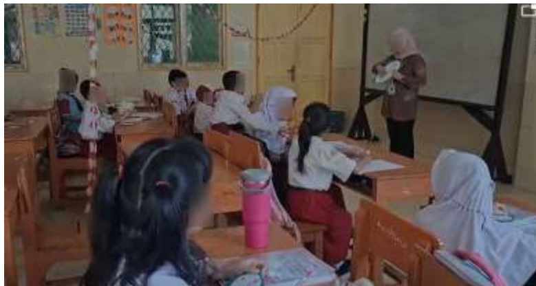
Gambar 2. Awal Kegiatan

Tahap berikutnya dalam kegiatan Pengabdian kepada Masyarakat adalah pelaksanaan edukasi konsep waktu menggunakan media jam analog. Pada tahap ini, kegiatan pembelajaran dilaksanakan secara langsung di dalam kelas dengan melibatkan seluruh siswa kelas III Sekolah Dasar. Kegiatan ini dirancang untuk memberikan pengalaman belajar yang konkret sehingga peserta didik tidak hanya mendengarkan penjelasan, tetapi juga terlibat langsung dalam proses pembelajaran. Melalui penggunaan media jam analog, peserta didik didorong untuk berinteraksi secara aktif dengan media pembelajaran. Peserta didik diberikan kesempatan untuk melihat, memegang, dan menggunakan jam analog secara langsung sehingga proses belajar mengajar menjadi lebih menyenangkan dan mudah dipahami. Pendekatan ini membantu peserta didik memahami konsep waktu dengan lebih baik karena pembelajaran disesuaikan dengan karakteristik dan kebutuhan belajar siswa kelas III Sekolah Dasar.